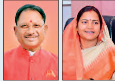
छत्तीसगढ़ ने पिछले माह की तुलना में 6 स्थानों की छलांग लगाकर पहला स्थान प्राप्त किया